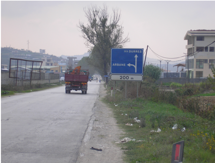
Km. 2.5 Kryqezim Arbane