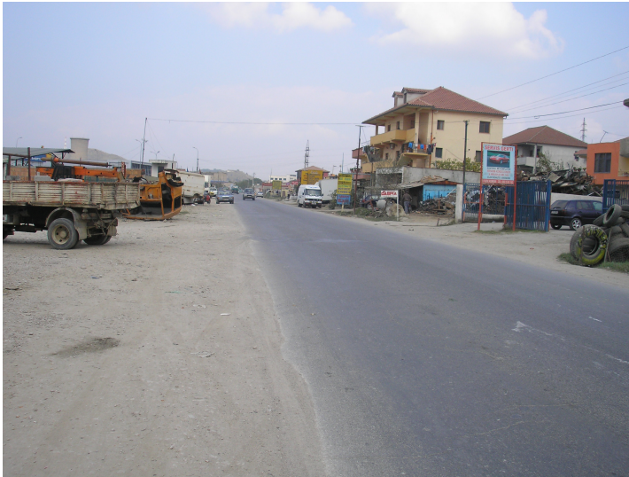
Km. 0.0 Dalje Kombinat qe eshte dhe fillimi I projektit

Aktualisht rruga Tirane – Ndroq - Plepa eshte nje rruge nacionale. Gjurma ekzistuese e ketij aksi rrugor fillon ne dalje te Kombinatit Tirane dhe zhvillohet pothuajse gjate gjithe gjatesise se saj ne krahun e majte te rrjedhjes se Lumit Erzen. Pikat me te rendesishme ku kalon rruga jane :