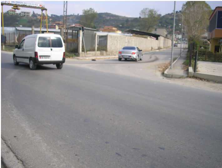
Km. 2.0 Kryqezim Vaqarr