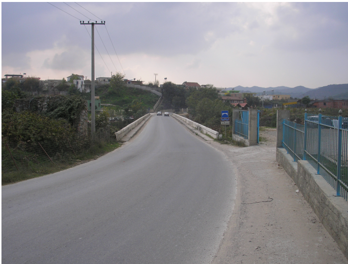
Km. 3.5 Nderprerja e Lumit Erzen, Ura e Beshirit