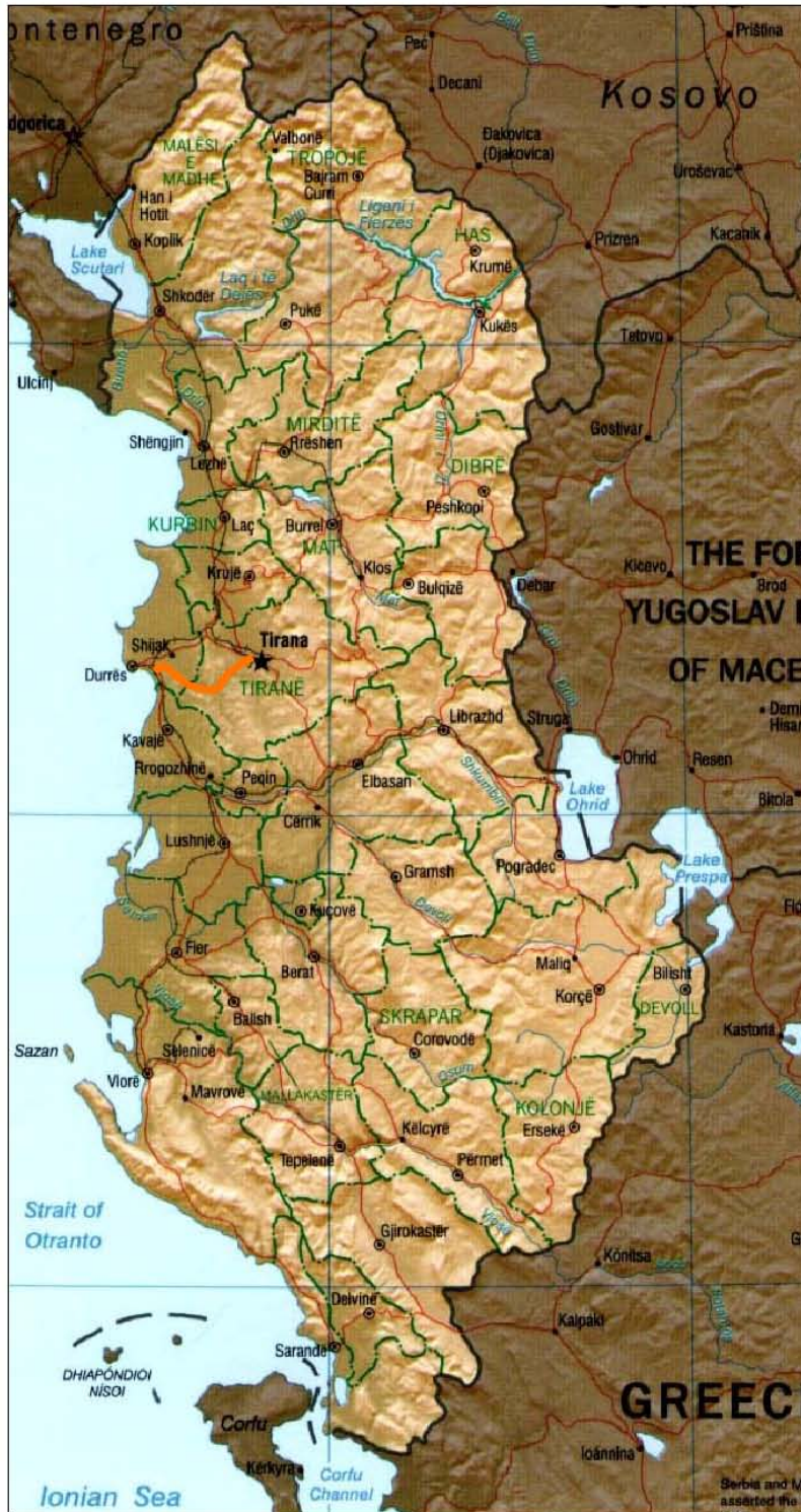
ZONA E INVESTIMIT