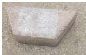
Pllaka 20x12x10x5.5cm ngjyre gri