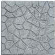
Pllaka 40x40x2.5cm ngjyre gri.

Permasat jane te specifikuara ne preventiv sipas pllakave, paketimi ne baleta 1 m3 pllakat jane nga njera ane me dekor.