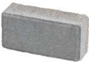
Pllaka 20x10x5.5cm ngjyre gri