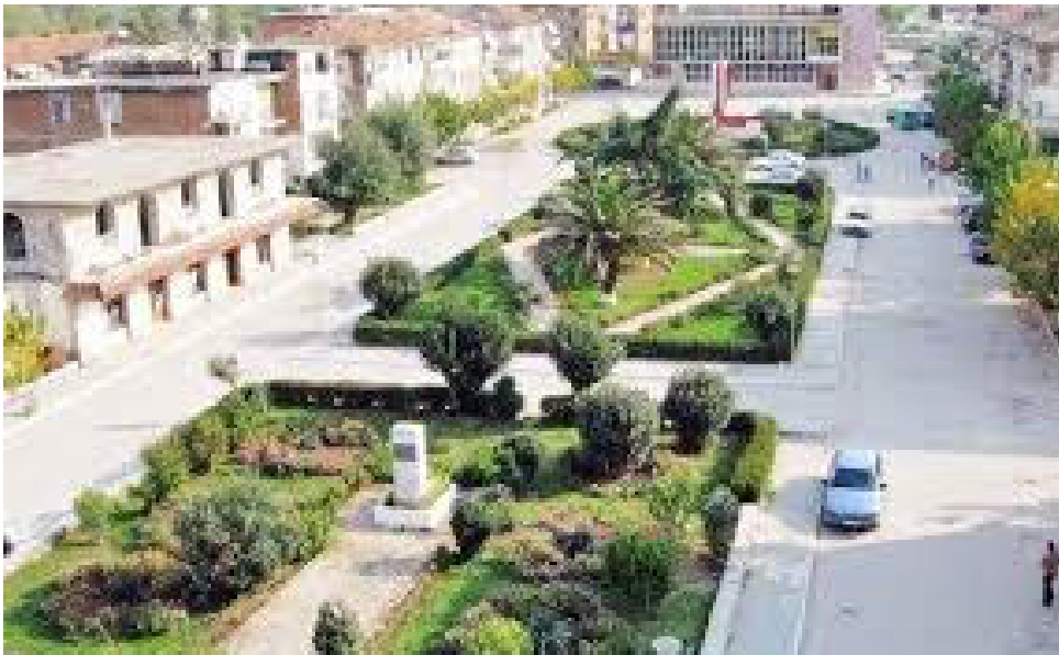
Fig.2 Qyteti i Memaliaj

Miniera e Memaliajt është më e rëndësishmja në vëndin tonë, me prodhim të një cilësie të mirë dhe me tregues teknikë dhe ekonomikë më të mirë se çdo minierë tjetër e vendit.