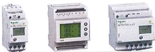
Figura 7: Pajisje matëse digitale sipas IEC 62053-21