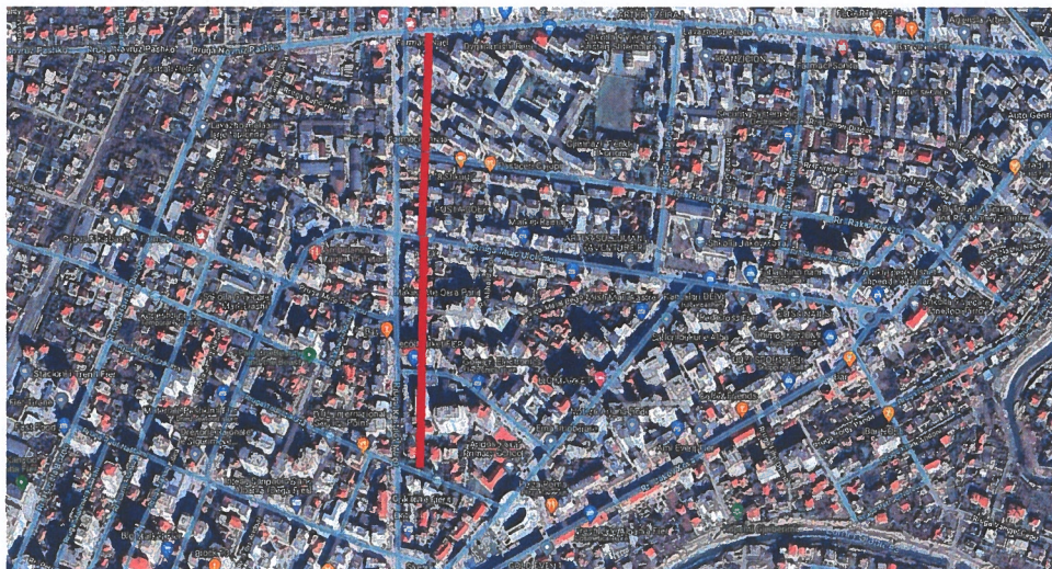
Zona e ndërhyrjes, rruga "Kastriot Muço".