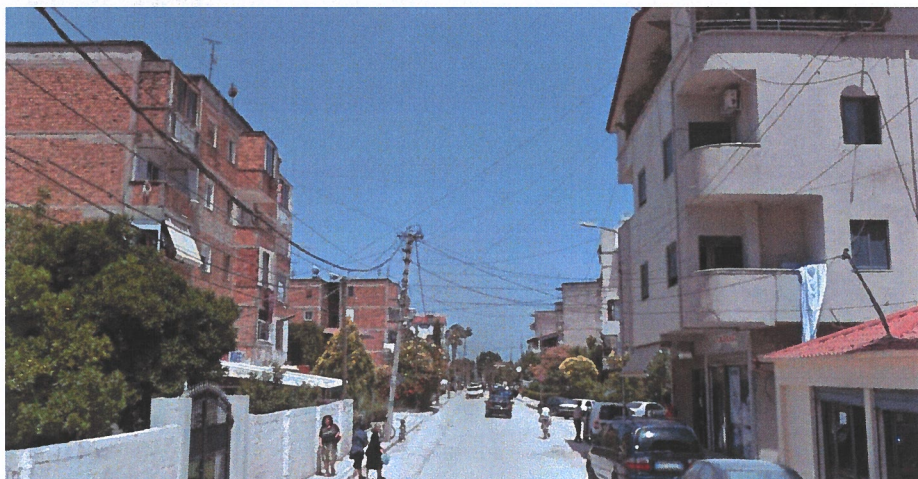
Panije nga rruga "Kastrito Muço"