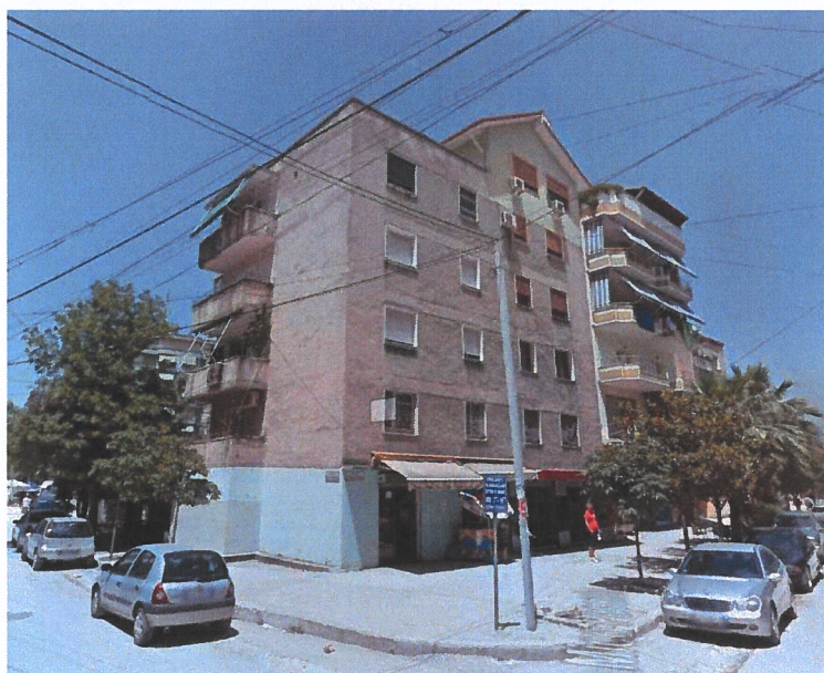
Panje nga rruga "Kastrito Muço"