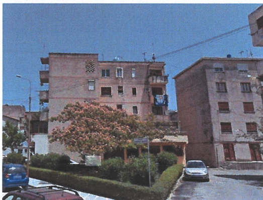
Pamje nga rruga "Kastrito Muço"