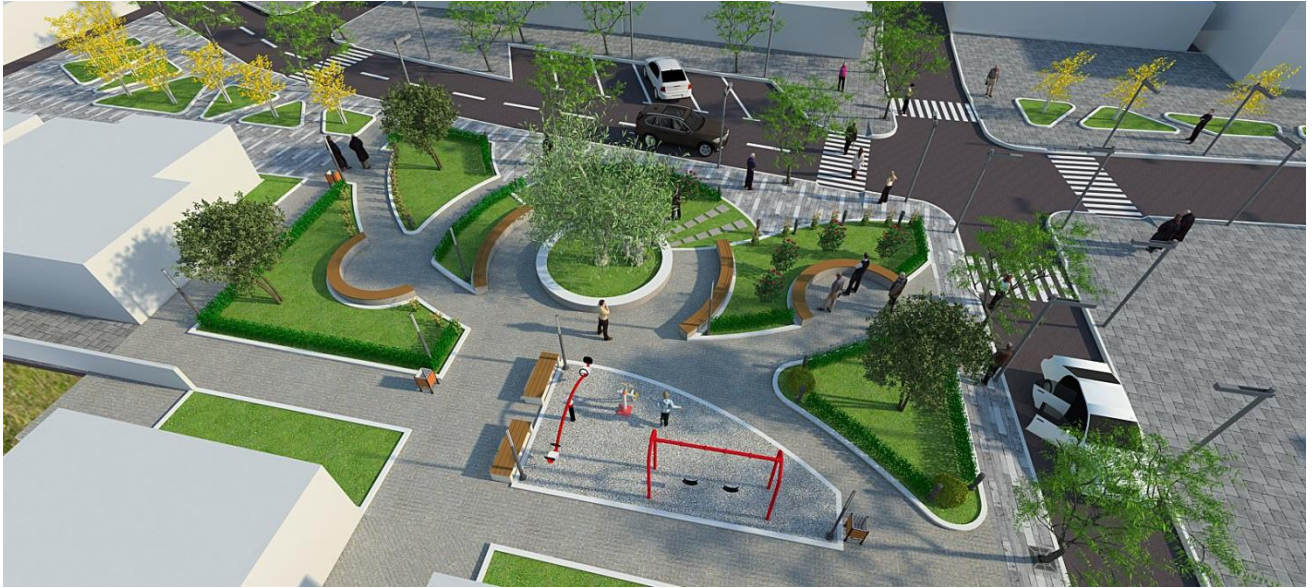
Figure 6 Imazh i sheshit te propozuar