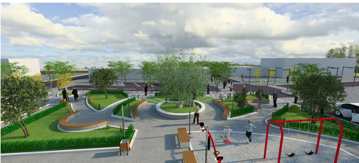
Figure 9 Imazh i sheshit te propozuar