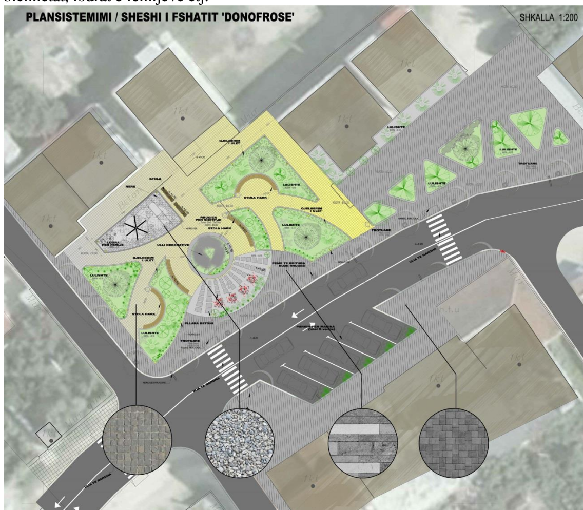
Figure 5 Plansistemimi i propozuar

Një vëmendje e vecante i është kushtuar edhe elementeve te mobilimit urban , te cilat jane përdorur në këtë zonë ,te tilla si: stola, kosha të mbeturinave, vendin e vendosjes së konteinerëve dhe të largimit publik të mbeturinave, zgara apo rrethime të pemëve, kangjella kufizuese në trotuare si dhe bllokues të mjeteve në trotuare, zgarat për bicikletat, lodrat e fëmijeve etj.