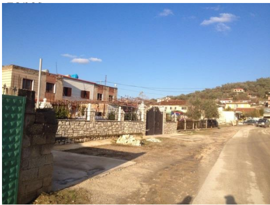
Figure 1 Foto te gjendjes egzistuese

Sheshi ka një sipërfaqe prej afërsisht 1000 m 2 sipas rlevimeve faktike, dhe ka akses direkt me rrugen kryesore te fshatit që rezulton i sfaltuar, duke krijuar akses të lehte për banorët e