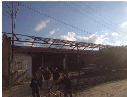
Figure 2 Foto te gjendjes egzistuese