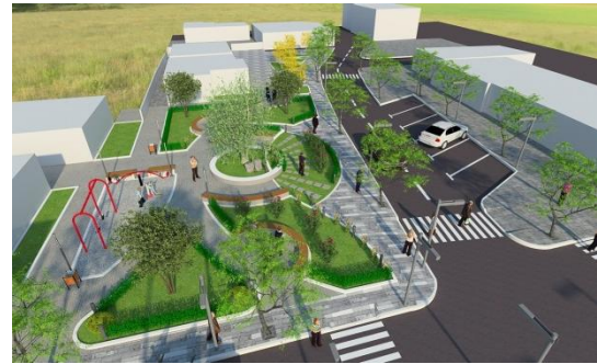
Figure 8 Imazh i sheshit te propozuar