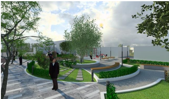
Figure 7 Imazh i sheshit te propozuar