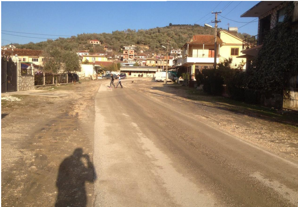
Figure 3 Foto te gjendjes egzistuese