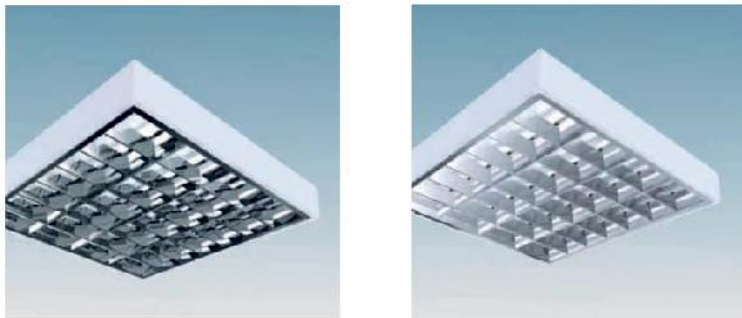
Figura 1 : Ndricues plafonier tavanor LED T8 4x 8W IP 20, per ndricimin e ambienteve te klasave dhe ambienteve te zyrave

Në figurën 13 dhe 14 jepen disa lloje ndricuesish të cilët në varësi të llojit të arkitekturës së tavanit realizojnë perfekt atë që kërkohet nga një zyrë me intesitet të lartë pune.