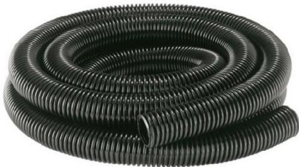
Figura 9: Tuba plastik fleksibel jashte murit

Keta tuba duhet te jene ne perputhje me kerkesat e standartit CEI EN 61386-1 Pershkrime te pergjithshme, CEI EN 61386-81 Pershkrime te vecanta etj.