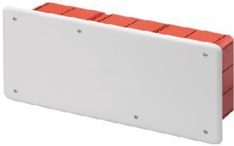
Figura 10: Kuti shperndarese plastike brenda murit

nga goditjet IK 07, Rezistenca ne temperature anormale apo ne zjarr ne prove 650 0 C. Instalim brenda murit. Kutia duhet te jete e instaluar rrafsh me siperfaqen e murit.