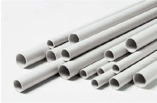
Figura 7: Tuba plastik jashte murit

Kutite shperndarese jashte murit duhet te kene grade mbrojtje sipas CEI EN 60529 = IP 55. Qendrueshmeri ndaj goditjeve IK07 ( 3 Jaul) sipas normes CEI EN 50102, ngjyra gri RAL 7035, rezistence ne flake versionet pa vida 650 0 C dhe 750 0 C per versionet e tjera sipas normes IEC 60695-2-1.