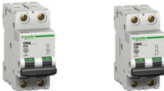
Figura 4 : Automatë dy polarë sipas CEI 60947-2