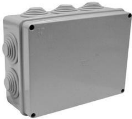
Figura 8: Kuti shperndarese plastike jashte murit

Kutite shperndarese jashte murit duhet te kene grade mbrojtje sipas CEI EN 60529 = IP 55. Qendrueshmeri ndaj goditjeve IK07 ( 3 Jaul) sipas normes CEI EN 50102, ngjyra gri RAL 7035, rezistence ne flake versionet pa vida 650 0 C dhe 750 0 C per versionet e tjera sipas normes IEC 60695-2-1.