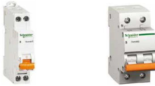
Figura 3 : Automatë një dhe dy polarë sipas CEI 60898