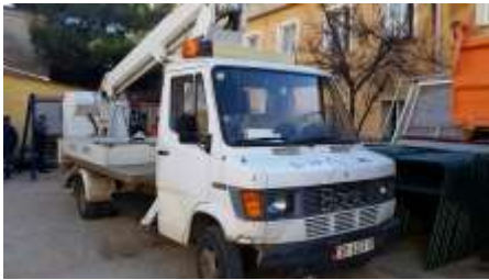
APV Mercedes benz tip kosh 408D me targa AB367HA viti 1991 shasia WD86113181P152749