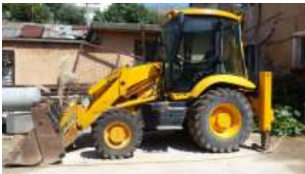
JCB 3cx Skrep me targa AGMT66 viti 2003 shasia SLP3CXTS3E09376681

Ndermarrja jone, zoteron keto automjete ,qe do te mirembahen dhe sherbehen sipas kesaj kontrate: