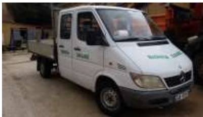
ATP Daimler Chrysler 311CDI Sprinter me targa AA979TX viti 2001 shasia WDB9036221R315902