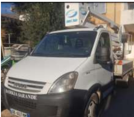
APV Iveco tip kosh me targa AB407MM viti 2009 shasia ZCFC3576005787897