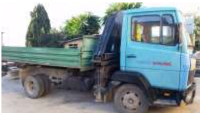
Daimler Benz 814 kamion me targa AA695FR viti 1986 shasia WDB67401215266219