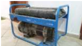
Gjenerator rryme : tip “BLIZZER” me benzene BL 5000.