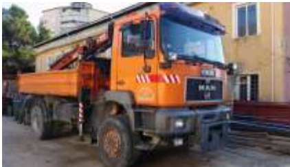
MAN kamion me vinç me targa AA792UG viti 2000 shasia WMAT34ZZZ1M308039