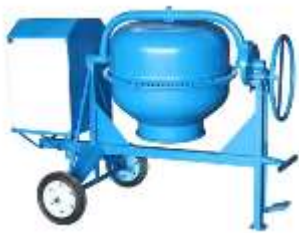
Betoniere ndertimi, 180 Lt, motorr 6.5 HP

Mjetet që zoteron Ndermarrja jone dhe që do të mirembahen ne vend jane: