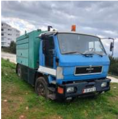
APV MAN Autobot E49 me targa SR6702B viti 1996 shasia WMAE490063L012351