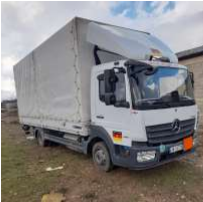
Automjet per transport mallrash me mbulese Mercedes Benz Atego me targa AB047DB viti 2017 shasia WDB96702110121010