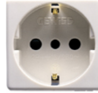
Fig. 2 Kontaktet e tokës

Gjithë prizat, derisa të bëhet një tjetër specifikim, duhet të jenë të tipit 16 amper 2-pin dhe të dalë në sipërfaqe. Ato duhet të kenë montim rafsh duhet të kenë një ngjyrë që të shkojë më paftat e çelësave të ndriçimit.