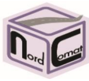
TABELA E PERMBAJTJES