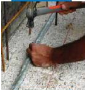
Fixing Idrostop B25 in place