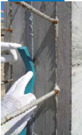
Applying Idrostop Soft on vertical surfaces