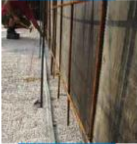
Laying Idrostop B25