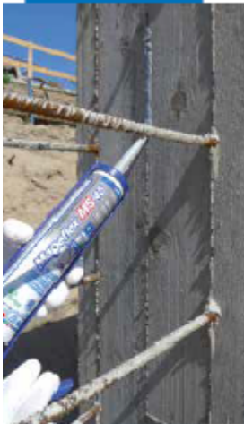
Extruding Mapeflex MS45 prior to applying Idrostop Soft in second pours