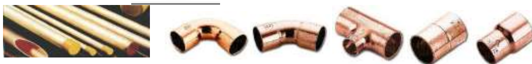
Standard Copper Pipe EN13348 and Copper Connection Parts according to ISO2016