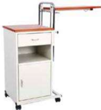
Ilustrimi Nr.2 - Komodinë Pacienti

Të jetë i pajisur me aksesori - Tryezë shtrati