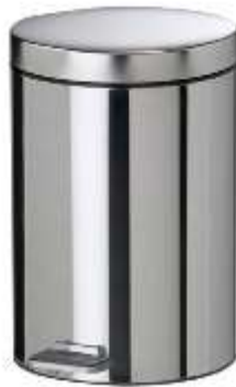
Ilustrimi Nr.9 - Kosha për mbetje urbane

Të përbëra nga 3 (tre) karrige të lidhura bashkë, me material inoks/kromuar dhe me ndenjësë inoks/kromuar të lyera metalizato, me mbajtëse anësore.