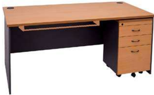
Ilustrimi Nr. 5 - Tavolinë pune me komodinë

Skeleti i shtratit të vizitave të jetë formuar nga skeleti i sipërm me profil katror 40 x 40 mm dhe spesor 1.5 mm i lyer me bojë të bardhë elektrostatische dhe i pjekur në temperaturë 180 gradë. Skeleti i sipërm të ketë katër këmbëza me të njëjtin profil të lyera njësoj si skeleti i sipërm me gjatësi afërsisht 12 cm. Në katër këmbëzat duhet të futen këmbët e inoksit të shtratit të cilat të jenë prej profili katror 35 x 35 mm me spesor 1.35 mm. Pjesa e dukshme e këmbës së inoksit të ketë gjatësinë 54 cm. Në pjesën e poshtme të cdo këmbë të ketë mbështetëse plastike e cila bën kontaktin me tokën. Në pjesën e kokës ose në pjesën e këmbëve të pacientit të vendoset një tub inoksi fi afërsisht 25 mm dhe spesor afërsisht 1,35 mm i cili shërben për mbajtjen e letrës rulo universale. Mekanizmi ngritës i pjesës së sipërme (kokës) së dyshekut të jetë në përputhje me dimensionet e shtratit.