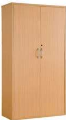
Ilustrimi Nr.7 - Dollap Pacienti

Konstruksioni metalik të sigurojë qëndrueshmëri