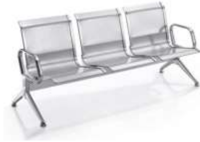
Ilustrimi Nr.8 - Stola pritjeje tre vendëshe