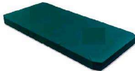
Ilustrimi nr.1 - Shtrat Pacienti / Dyshek