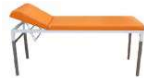
Ilustrimi Nr.4 - Shtrat Vizite

Dyshek me shkumë të dendur me mbulim antibakterial, të papërshkueshëm nga uji dhe me zippered