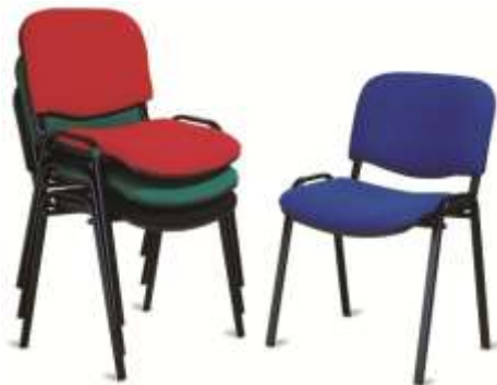
Ilustrimi Nr.6 - Karrike kë thjeshta

Ngjyrat janë të ndryshme dhe përcaktimi i saktë i tyre do të bëhet në kushtet e lidhjes së kontratës.