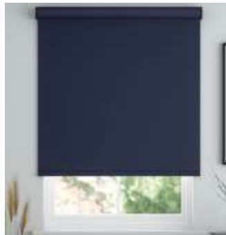
Ilustrimi nr.10 - Perde