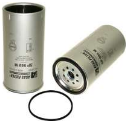
Pamje per ilustrim

Pjesa qe do te zevendesohet ka keto te dhena : kodi teknik... 04.014.11352 ose ekuivalent