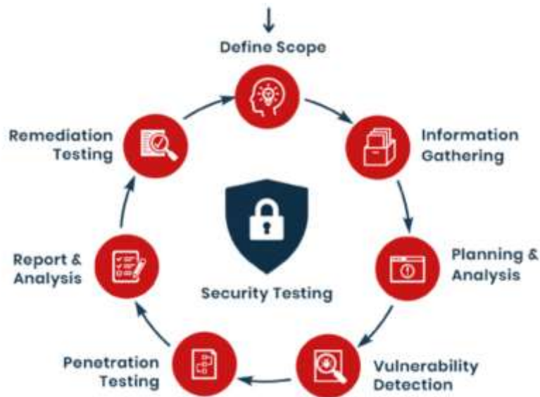
Figure 1-Testimi i sigurisë