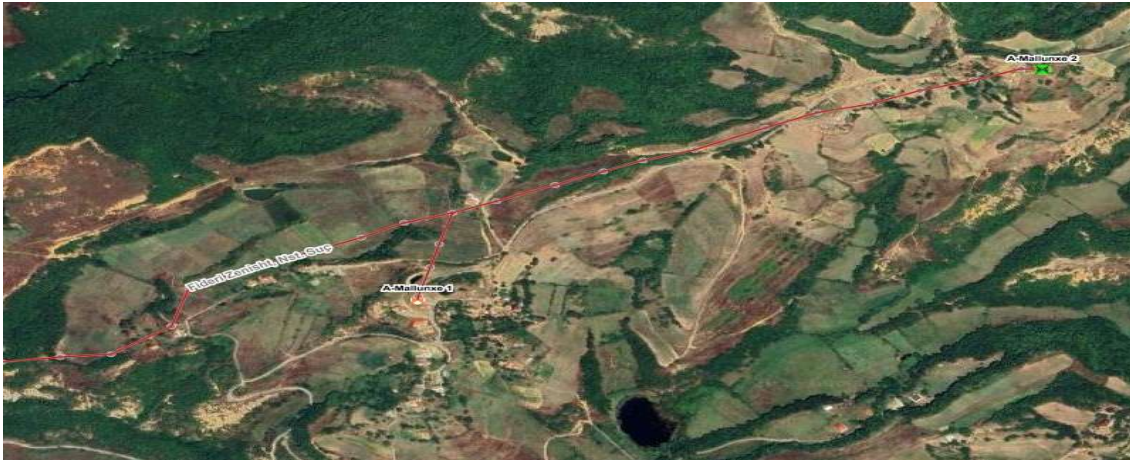
Zona Zenisht, Mallunx