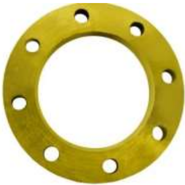
Fllanxhe DN 80 PN 10 celiku me 8 vrima per tub