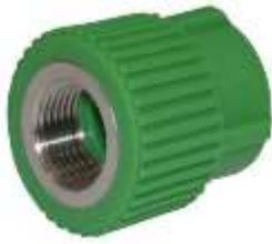
Manikot PPR me fileto \varnothing 20 \times 1/2'' , \varnothing 25 \times 3/4'' , \varnothing 32 \times 1'' F