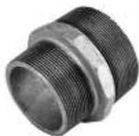
Niples xingato 1/2"-2"