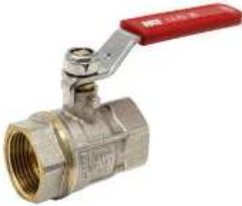
Saraçineskë me levë PN 25 , 1"-2"