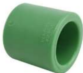
Manikote PPR ø20-32