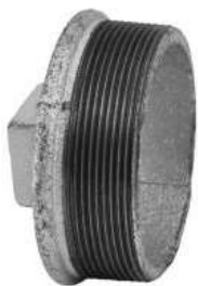
Tape xingato 1/2"-2"