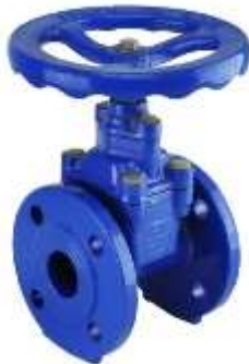
Saracineska PN 16 me flanaxhe me volant dhe Volant mbylles gome DN \varnothing 50 , \varnothing 80 , \varnothing 100 , \varnothing 125 , \varnothing 150 , \varnothing 200 , \varnothing 300

Saracineskat duhet te jene te tipit me gjuhez ne formë pyke. Gjuheza ka formen e nje pllake fleksibel e cila mundeson rrjedhjen apo bllokimin e ujit neper tubacione. Cvendosja e gjuhezes behet me ane te nje boshti i cili eshte i pajisur me fileto me seksion trapezoidal. Komandimi boshtit behet manualisht me dore nepermjet volanit ose me mekanizem ne rastin e saracineskave te cilat jane me dimension me te madh se \varnothing 300 . Trupi i saracineskes duhet te jete I perbere prej materiali gize ku te shfaqin rezistence ndaj temperaturave ambjentale - 20^{\circ}\text{C} deri ne + 45^{\circ}\text{C} dhe presionit 16bar. Ne trupin e saracineskave duhet te kete te inkorporuar nga te dyja anet flanaxha te cilat konstruktivisht duhet te jene sipas standardit ANSI ose ekuivalent. Saracineskat duhet te jene te pershtatshme per linjat e ujit te pijshem per ta vertuar ofertuesi ne oferten e tij duhet te paraqesi certifikaten perkatese (psh WRAS, DVGW ose ekuivalentin e saj ) nga nje Institucion i Pavarur.