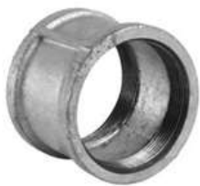
Manikot xingato 1/2"-2", 3/4"*1/2"