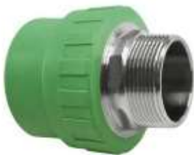
Manikot PPR me fileto \varnothing 20*1/2", \varnothing 25*3/4", \varnothing 32*1" M