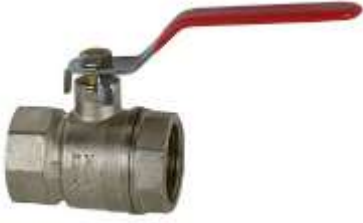
Saraçineskë me levë PN 25 , ½"-1"