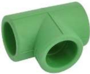
Ti PPR E thjeshte \varnothing 20-32