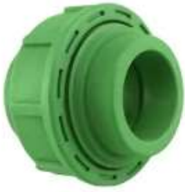
Bashkuese hollandeze PPR