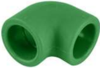
Bryl PPR \varnothing 20-32