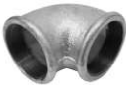
Bryl xingato 1/2"-1"