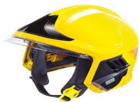
Për zjarrfikësin operues

Në mes të gëzhhojës, e cila duhet të jetë e punuar nga materiale kompozite (fibra karboni), dhe poliuretanit (e integruar në poliuretan) duhet të jetë e integruar një gëzhhojë e dytë dhe një shkumë izoluese.