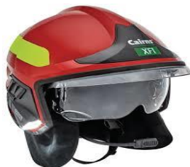
Për drejtuesin/komandantin e zjarrfikësit