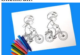
ROAD SAFETY Coloring Pages!