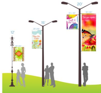
Pole Flag Sizes