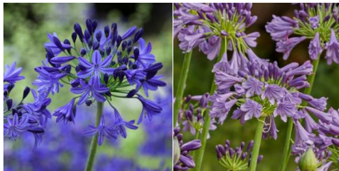
Foto ilustruese e Agapanthus