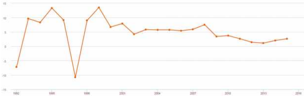
Figura 1: Norma e Rritjes Vjetore të PBB (%) 1

Shqipëria ka shfaqur performancë të fortë makroekonomike që në vitin 2008, duke ruajtur një nivel rritjeje afër 6 për qind ndërmjet viteve 2003 dhe 2008. Kriza financiare e uli këtë nivel në 3 për qind, megjithatë, krahasuar me vendet e tjera të Evropës Qendrore dhe Lindore, Shqipëria është pothuajse vëndi i vetëm që ka gjeneruar rritje reale pas krizës financiare.