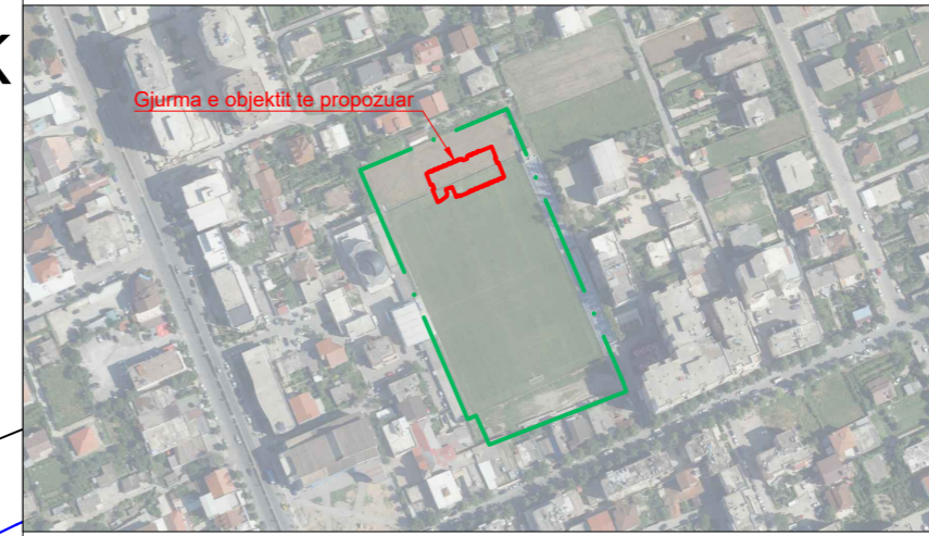
POZICIONI I PRONES SIPAS HARTES SE ASHK-se SHK. 1:2500