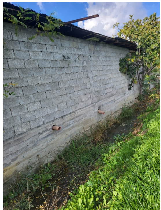
Fig. 1-4 Foto të gjëndjes ekzistuese