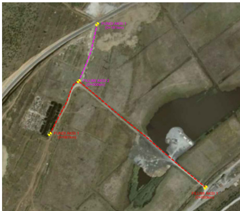
Horografia e Rrugës

Objekti "Sistemim Asfaltim i se varrezave, Bashkia Bulqize" ka një gjatësi prej Aksi 1 L=681m dhe Aksi 2 L=181m.