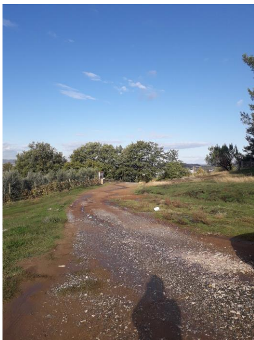
FOTO TË GJENDJES EKZISTUESE