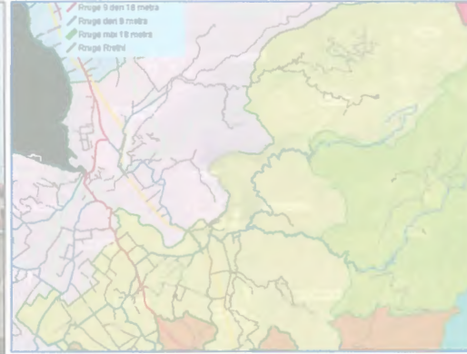
Sistemi rrugor ne bashkine Vau Dejes