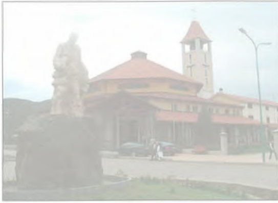
Qendra ekzistuese e qytetit