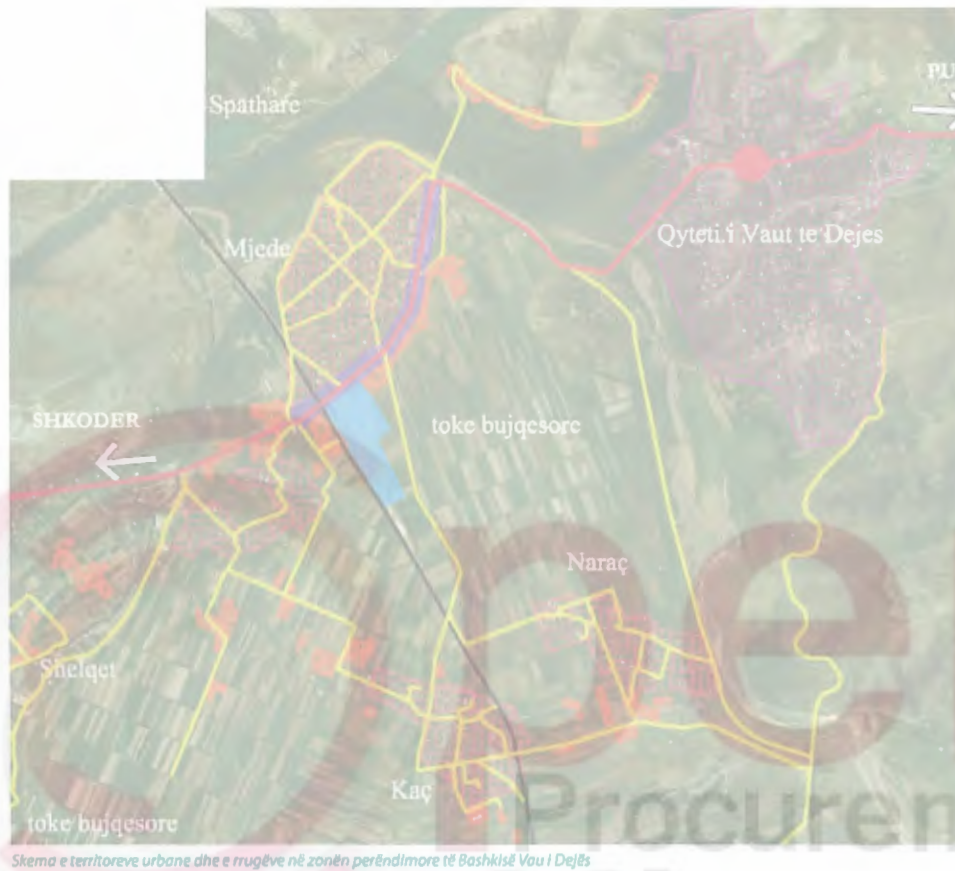
Skema e territoreve urbane dhe e rrugëve në zonën perëndimore të Bashkisë Vau i Dejës

Per shkak te pozicionit gjeografik te Bashkise si dhe kalimi i rruges kombetare Shkoder Puke mespermes territorit te saj ka ndikuar ne nje konfiguracion urban te veçante.