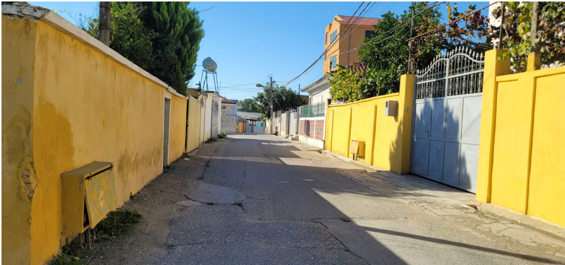
Pozicioni i rruges ne lidhje me harten.