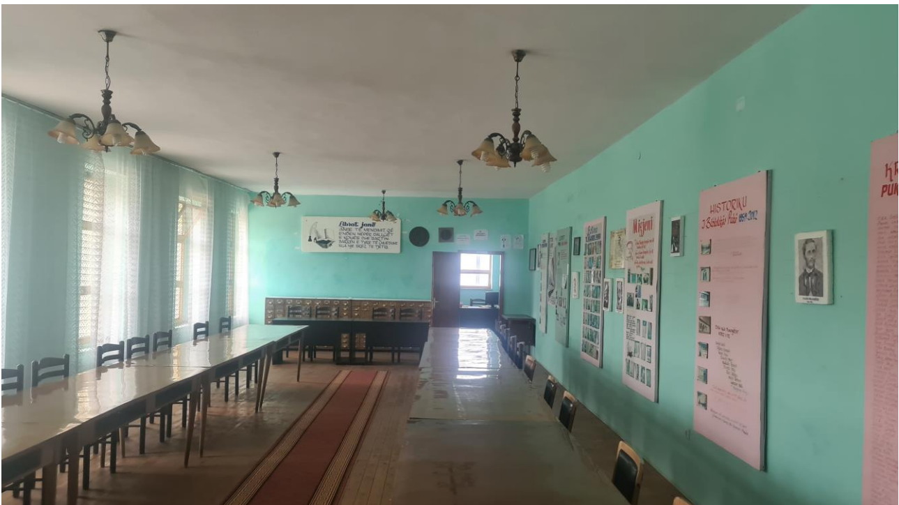
Fig. 3 Pamje ekzistuese e sallës së leximit.