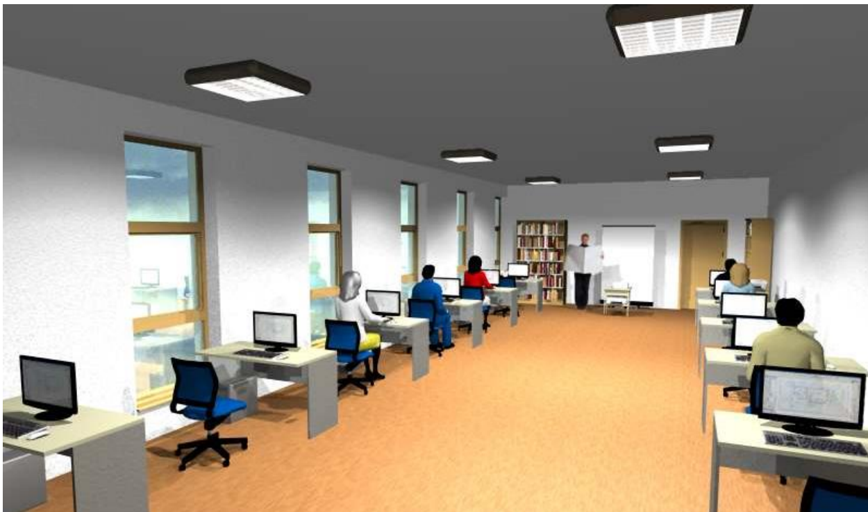
Fig. 4 Pamja 3D e sakkës së leximit të rikonstruktuar.