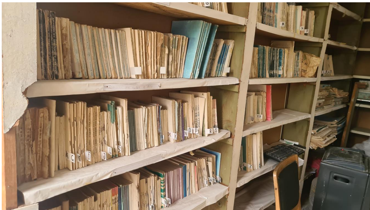
Fig. 1 Pamje e standave të librit në bibliotekë.