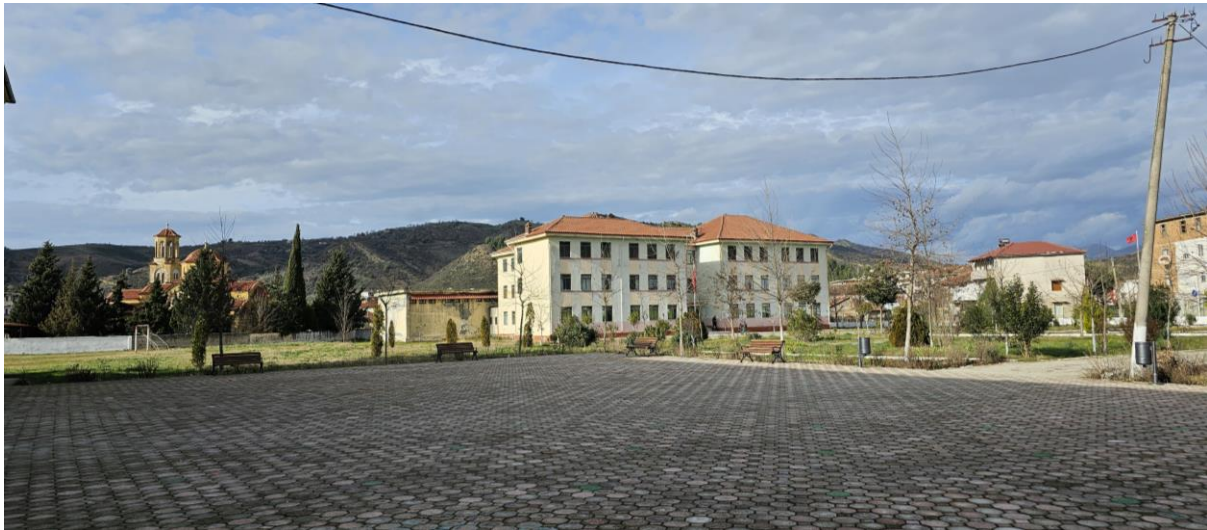
Gjendja Ekzistuese e gjimnazit "Sali Nivica"

Krijimi i ambienteve bashkohore, per nje arsimim sa me te mire te nxenesve eshte i domosdoshem dhe per permiresimin dhe persosjen e kushteve te punes se mesuesve, me qellim rritjen e cilesise se mesimdhencies ne shkolle me standarte bashkohore.