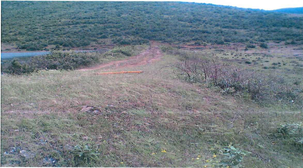
Puseta e ujleshuesit me saraçineskat te demtuara