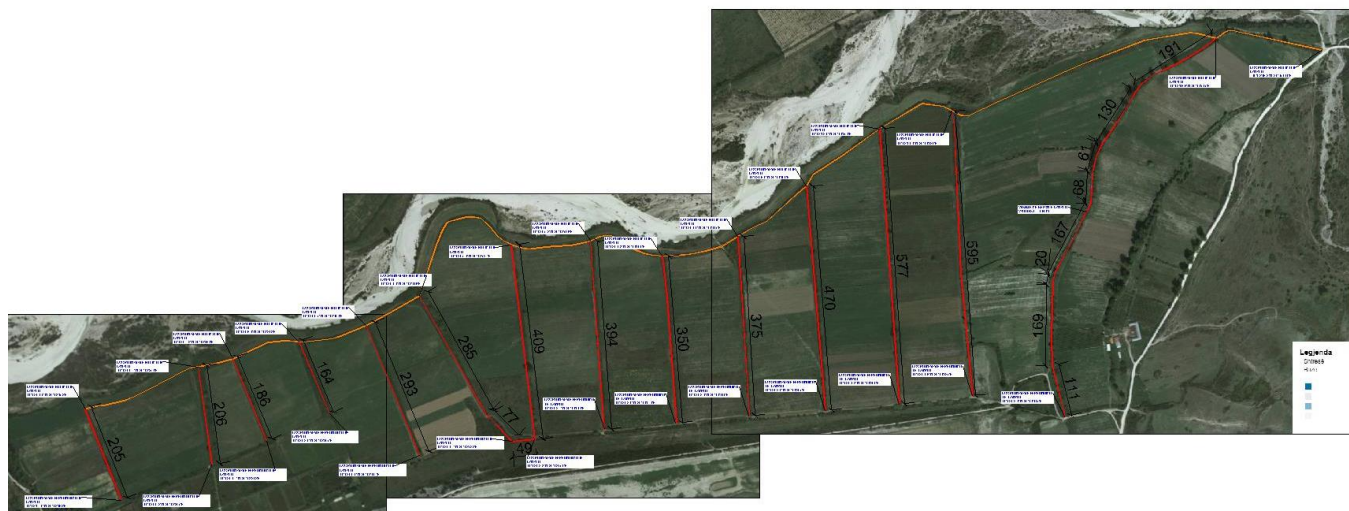
Fig-1. Horografia ( Kanalet pjese e projektit )

Gjatesia totale e kanaleve te perfshira ne kete projekt eshte 8440 ml, ndersa gjatesia e secilit kanal varion nga 164 – 2950 ml.