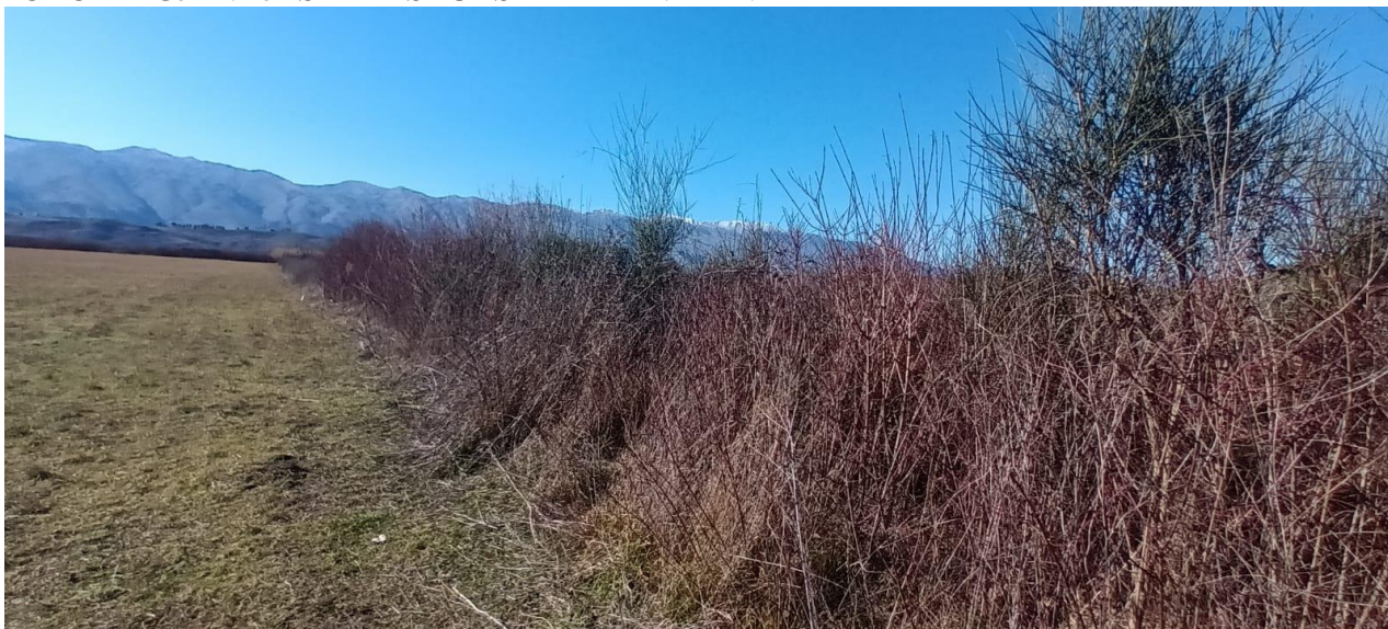
FOTO TE GJENDJES EKZISTUESE TE KANALEVE