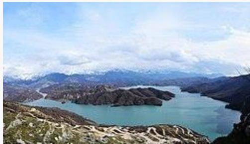
Pamje e liçenit