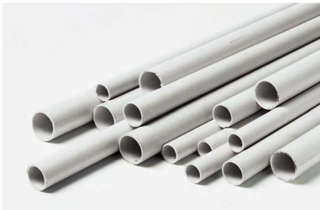
Figura 7: Tuba plastik jashte murit

Kutite shperndarese jashte murit duhet te kene grade mbrojtje sipas CEI EN 60529 = IP 55. Qendrushmeri ndaj goditjeve IK07 ( 3 Jaul) sipas normes CEI EN 50102, ngjyra gri RAL 7035, rezistence ne flake versionet pa vida 650°C dhe 750°C per versionet e tjera sipas normes IEC 60695-2-1.