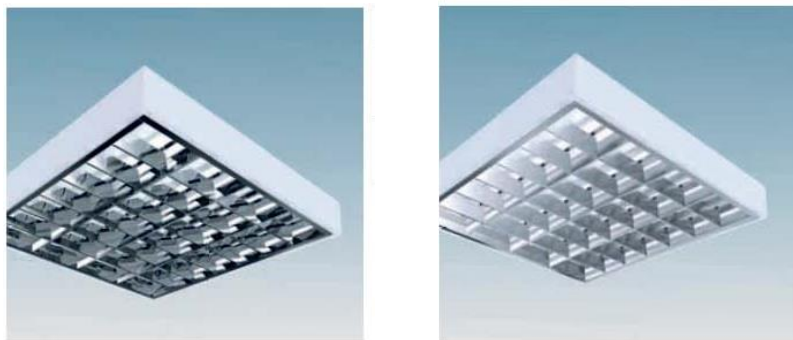
Figura 1 : Ndricues plafonier tavanor LED T8 4x 8W IP 20, per ndricimin e ambienteve te klasave dhe ambienteve te zyrave

Në figurën 13 dhe 14 jepen disa lloje ndricuesish të cilët në varësi të llojit të arkitekturës së tavanit realizojnë perfekt atë që kërkohet nga një zyrë me intesitet të lartë pune.