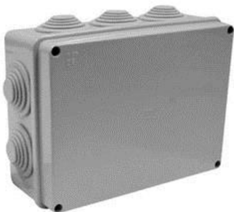
Figura 8: Kuti shperndarese plastike jashte murit

Kutite shperndarese jashte murit duhet te kene grade mbrojtje sipas CEI EN 60529 = IP 55. Qendrushmeri ndaj goditjeve IK07 ( 3 Jaul) sipas normes CEI EN 50102, ngjyra gri RAL 7035, rezistence ne flake versionet pa vida 650°C dhe 750°C per versionet e tjera sipas normes IEC 60695-2-1.