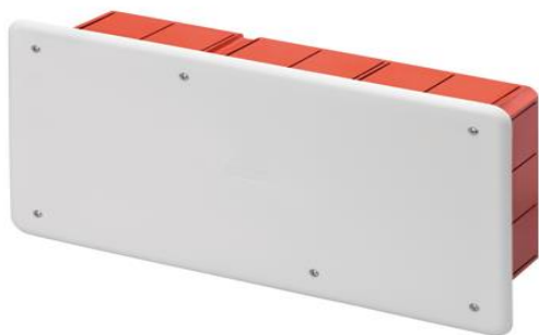
Figura 10: Kuti shperndarese plastike brenda murit

nga goditjet IK 07, Rezistenca ne temperature anormale apo ne zjarr ne prove 650°C. Instalim brenda murit. Kutia duhet te jete e instaluar rrafsh me siperfaqen e murit.