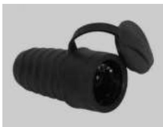
16A 2P+PE IP44 50cope(set)