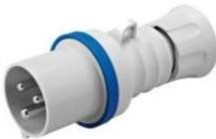
16A 10 cope(set)