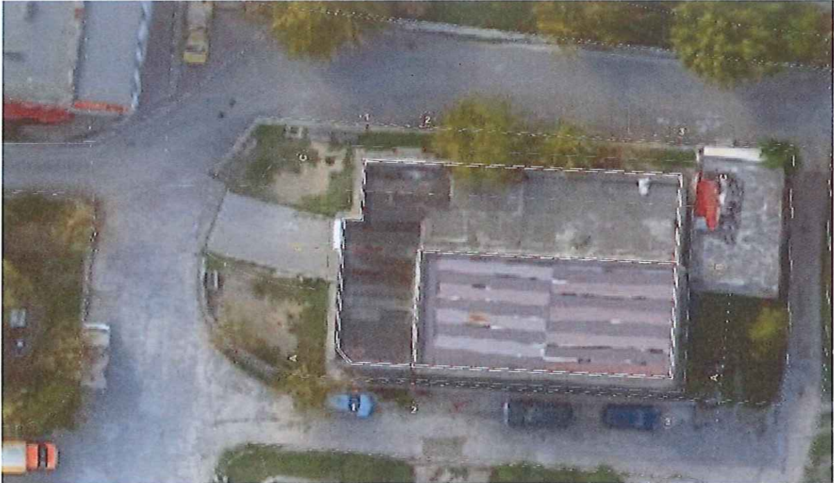
Foto te gjendjes ekzistuese

Përpara çdo aktiviteti ndërtimor, Sipërmarrësi do të ketë të ndërtuara linjat e furnizimit me ujë dhe energji elektrike të vendosura në terren, si dhe rrugët e hyrjes në objekt. Çdo punë e bërë jashtë akseve, kuotave dhe kufijve të treguara në vizatime ose të mosmiratuara nga Punëdhënësi nuk do të paguhet, dhe Sipërmarrësi do të mbulojë me shpenzimet e tij gërmimet shtesë gjithmonë nën drejtimin e Mbikëqyrësit të Punimeve.