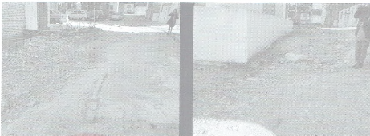
Foto te gjendjes aktuale