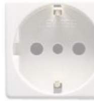
Fig. 2 Kontaktet e tokës

Gjithë prizat, derisa të bëhet një tjetër specifikim, duhet të jenë të tipit 16 amper , të dala në sipërfaqe dhe me kapak mbrojtës. Ato duhet të kenë montim rrafsh duhet të kenë një ngjyrë që të shkojë me paftat e çelësave të ndriçimit.