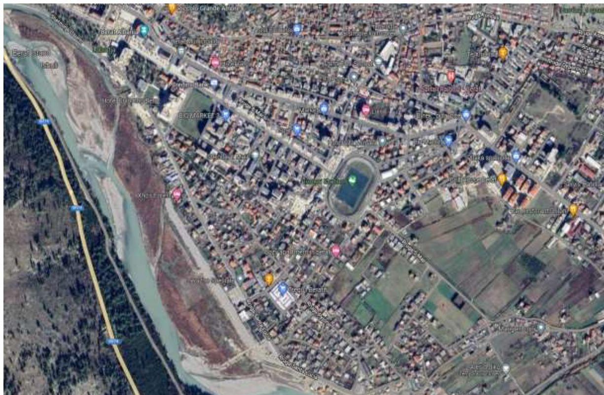
Figura 1- Gjendja aktuale e rrugeve qe bejne lidhjen Shetitore Osumi - Bypass

Rruga e re parashikohet te jete rreth 1.1 km.