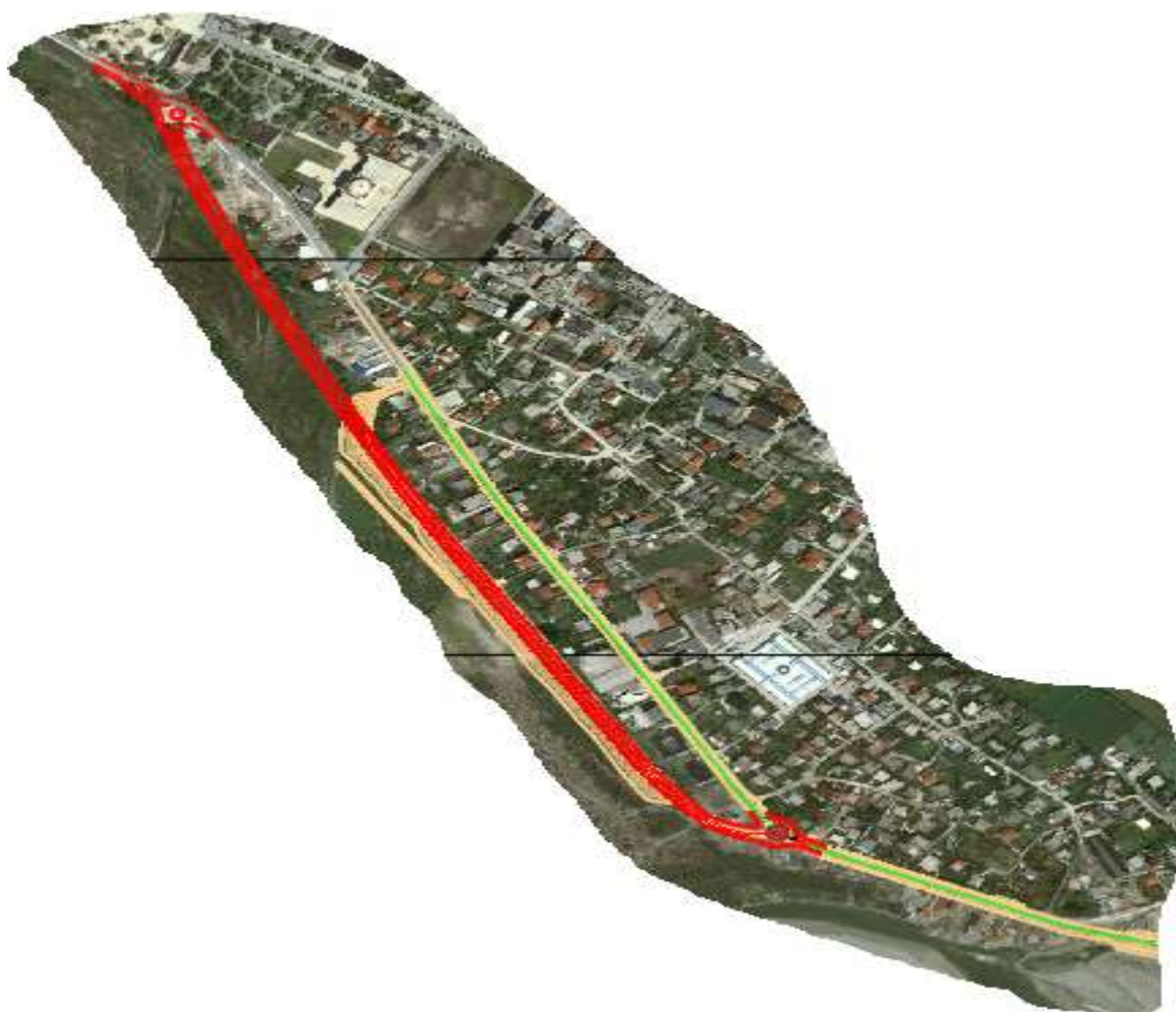
Figura 3- Gjurma e propozuar e Rruges lidhese

Nisur nga fakti që rruga kalon paralel dhe shumë pranë shtratit të lumit Osum, projektuesi duhet të kushtojë një rëndësi të veçantë sjelljes së lumit, duke bërë studimin gjeologjik, hidrologjik dhe hidroteknik për të arritur në një zgjidhje sa më të mirë teknike dhe ekonomike.