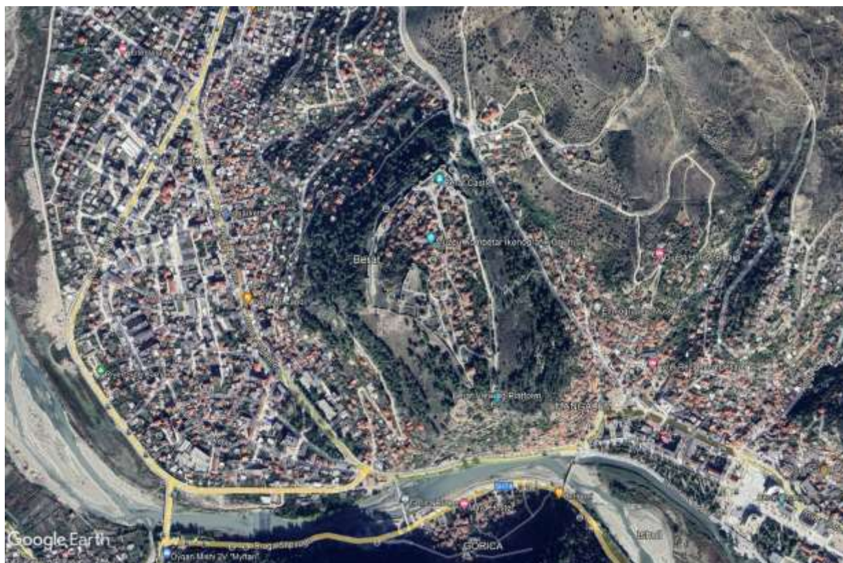
Figura 1- Foto nga Google Earth e qyteit të Beratit

Në çdo periudhë reshesh të vazhdueshme lumi Osum del nga shtrati në zona të ndryshme duke përmblytur shumë banesa dhe rruge te qytetit.